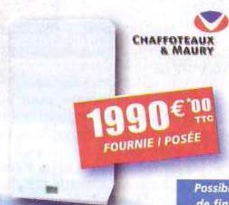
Chaudière à condensation MIRA GREEN 24FF