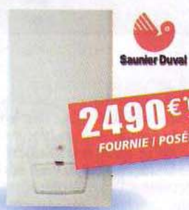
Chaudière à condensation THÉMA+ CONDENS 24/30